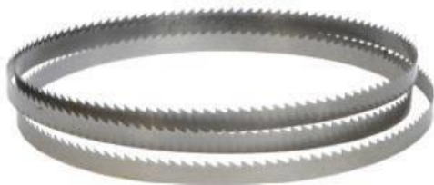
Disponible en 27 & 34 mm

En 2016, vous pouvez compter sur la qualité de notre service client comme auparavant. Nous vous tiendrons aussi informés de tous nos nouveaux développements.